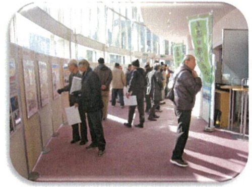
中ホールエントランスの様子

また、会館内では活動組織紹介、フォトコンテスト応募作品の展示、三重県PRブース等が設けられ、参加者は時間の合間を見計らって見入っていました。