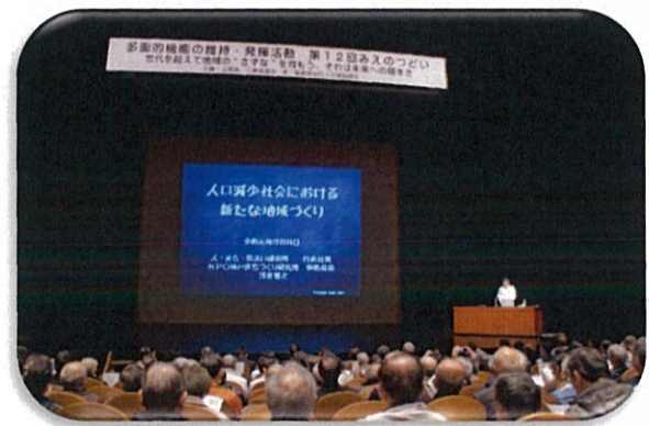
中ホールの基調講演の様子

その後休憩を挟み、参加者はおのこの希望したテーマの分科会の研修を受けるため各会場へ移動しました。