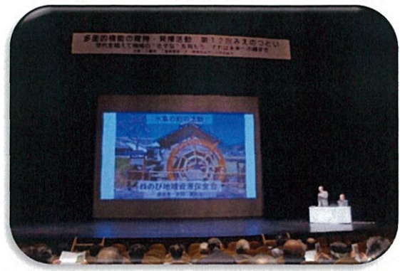
第1分科会（ねのび地域資源保全会）の様子

第2分科会では、「より良い地域づくりに向けて」～次世代リーダーへの継承・活動の自立に向けた体制づくり～をテーマに、第3分科会では、「むらの応援企業を呼び込もう！」～企業と連携したむらづくり～をテーマに、第4分科会では、「三重まるごと農村体験」～子供たちとともに取り組む地域活動～をテーマにワークショップを行いました。