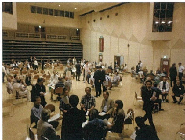
フリートークの様子