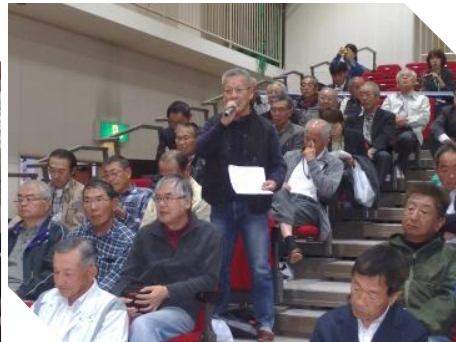
意見交換会での概要を報告している様子