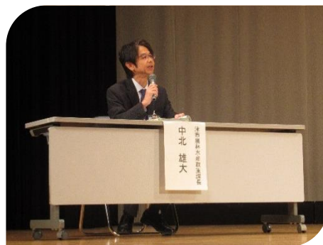
パネルディスカッション (コーディネーター 津市 中北課長)

参加者の皆様にご協力いただいたアンケートでも約8割の方から「興味深かった」「役に立った」との回答をいただき「制度概要の説明が分かりやすかった」、「課題解消は難しいが様々なアイデアを聞いてよかった」といった前向きな感想が目立ちました。また、「活動規模が小さな活動」、「若手の意見も聞きたい」などの意見が多く、今後の活動への取り組みが期待されている事がうかがえました。