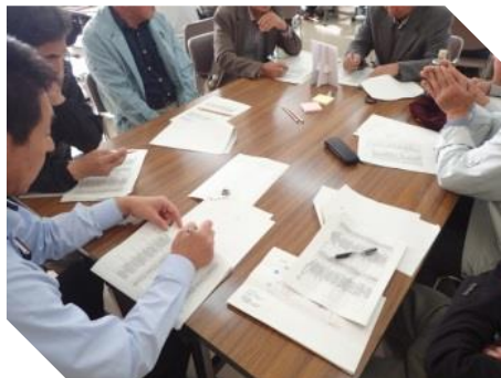
意見交換を行う様子

参加された方からは「他の活動組織の話聞き、課題を共有することができて良かった」「取り入れたい他地区の活動を見つけられた」など参加して視野が広がったという意見をいただきました。さらに「もっと多くの人と意見交換したかった」など活動をよりよくしていきたいという強い思いを感じる意見もありました。