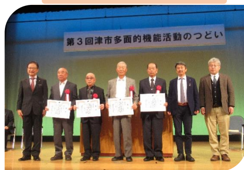
受賞された組織の皆様の記念撮影