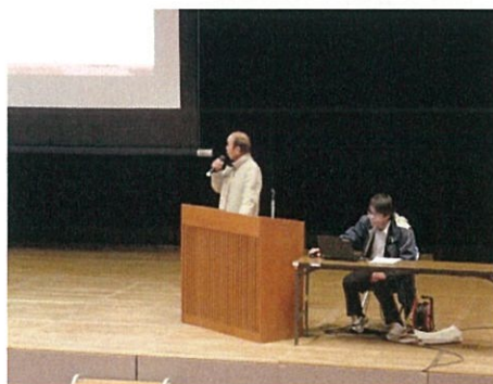
度会町 田口農水会