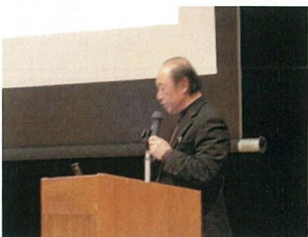
玉城町 原農水環境を守る会