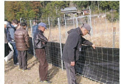
防草シートを確かめる参加者

引き続き、「獣害柵の補修・強化について」をテーマに三重県中央農業改良普及センターの木村主査を講師にお招きし、三重県中央農業改良普及センターや農業研究所の指導の下、紀北町大原地区において獣害柵の補修・補強の実証実験に取り組んだ状況や各種防護柵の特徴、設置上の注意点について、写真や動画を用い紹介していただきました。