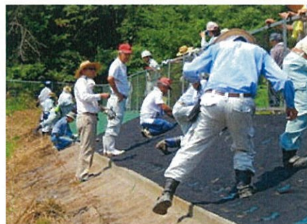
防草シート敷設現地講習の様子

そして当日ご参加されました活動組織の皆さまには、ご協力いただきありがとうございます。