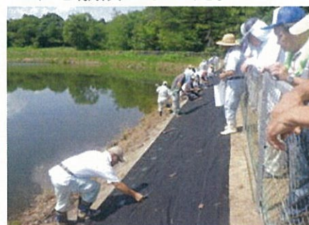
防草シート敷設現地講習の様子

この日は、朝から35度を超える猛暑のなか、全員汗だくになりながら作業を行いました。作業を終えて、防草シートが敷設された堤体の前では、これで10年持つのなら草刈り作業も軽減されて楽になるという声も聞こえ、今回の講習会が今後の活動の参考になったのではないかと実感しました。