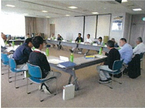
役員会において検討

早く農地造成された地区は、40年以上経ち、農業用施設の老朽化が進行していることから、御浜地域環境活動組織役員会において、老朽化した施設の整備補修箇所、ポンプの更新など、全地区（14地区あり）のバランスも考慮いただき、整備に至っております。