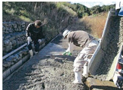
コンクリートによる 農道補修