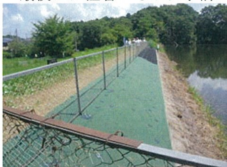
施工後の堤体法面

最後に、猛暑のなか、事前に現地の準備をしていただいた「美旗中村まもりたい」の組織の皆さま、