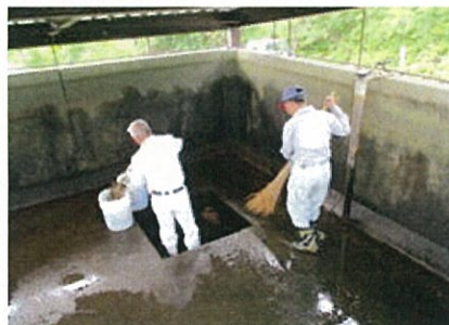
ファームポンドの 木の葉や泥などの堆積物除去