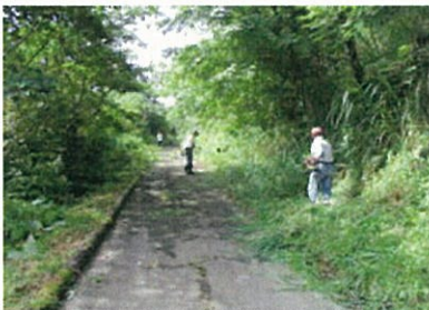
農道及び農道沿いの草刈り

主な活動としては、農用地・水路・農道の草刈り、水路の泥上げ、ファームポンドの清掃、農道・水路の補修（軽微な補修は、業務委託ではなく、自主施工して質的向上を図っています。）