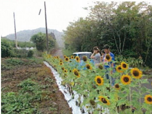
足を止め、景観作物をながめる住民

地区組合員のみならず、一般住民もよく利用されている農道においては、景観をよくするため、ひまわり栽培を行いました。また、ゴミの不法投棄を防止するため防護ネット設置作業も行いました。