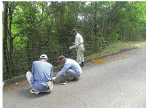
ゴミ不法投棄防止ネットを設置