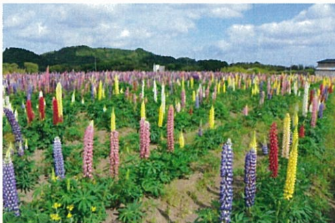
花開道一面に咲き誇るルピナス

当保全会は、地元の婦人会、老人会、消防団、農家組合などで構成されており、平成20年度から遊休農地を活用した花の植栽に取り組み「花開道」という花畑を整備し、景観形成とともに遊休農地の有効活用を図っています。