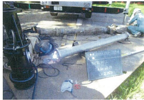
農業用水ポンプ（後）

津村町地区農地・水・環境保全会では、この活動を通して地域との良好な関係づくりとともに景観の保全に繋げ、活動を向上させていくことにより、農業が現在から未来へ継続していくよう、更なる取り組みを行っていきます。