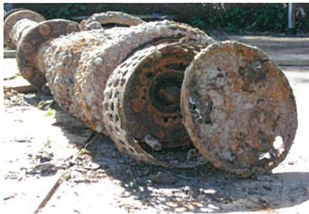
農業用水ポンプ（前）

その結果、農用地への農業用水安定供給の確保が成され、円滑に農作業を進めることが可能となりました。