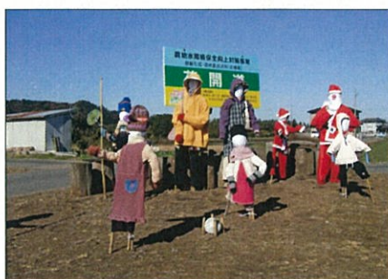
鳥害対策用のかかし

5月には花菱草やルピナス、ポピー、9月にはコスモスやひまわり、ホウキ草が咲き誇り、たくさんのお見物者が訪れ、期間中は大盛況となっています。