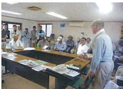
業者による公民館での説明

当日は、名張市管内の活動組織17組織から39名、事務局7名の46名の参加がありました。