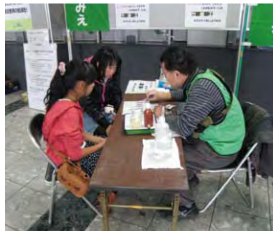
パケットテストにチャレンジする子どもたち