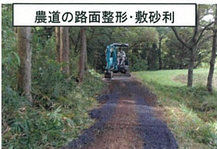
農道の路面整形・敷砂利