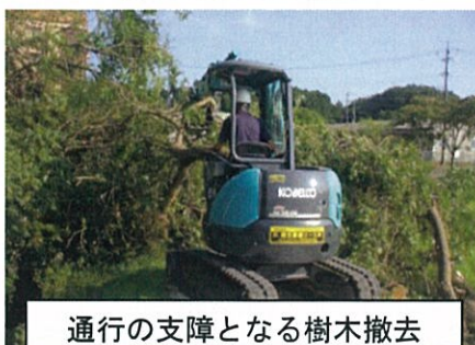
通行の支障となる樹木撤去