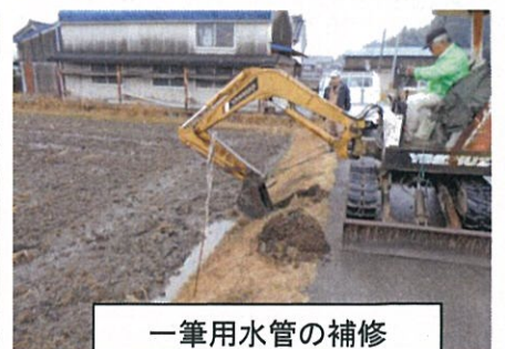
一筆用水管の補修