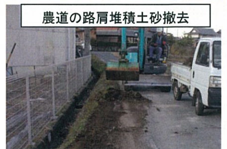
農道の路肩堆積土砂撤去