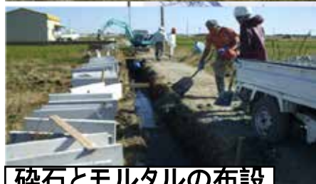
砕石とモルタルの布設