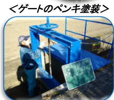
＜ゲートのペンキ塗装＞