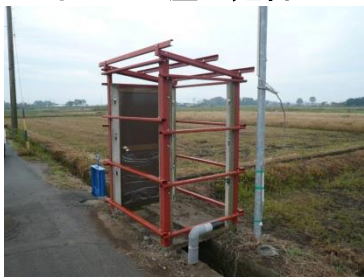
＜ポンプ小屋の建替え＞

平成30年度は老朽化したポンプ小屋の建て直し、水路補修したり、ゲートのペンキ塗装をしたり、揚水井戸の維持をしたり、長寿命化の計画で水路を更新したり、…と、様々な活動を地域住民が力を合わせて、直営施工で実施しました。