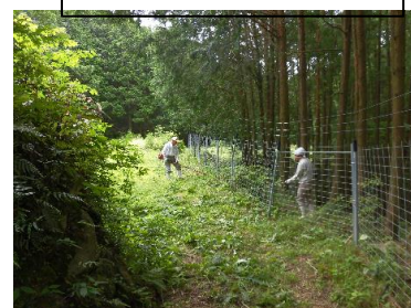
獣害防護柵の維持管理