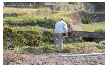
畦畔・農用地法面の草刈り