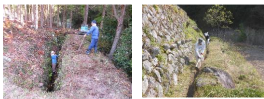
水路の泥上げ作業