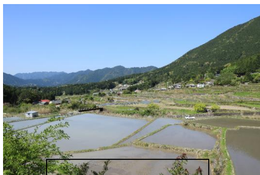
阪本地区の田園風景