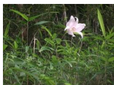
西山水井やまゆり