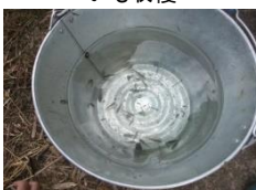
採れた魚(めだか等)