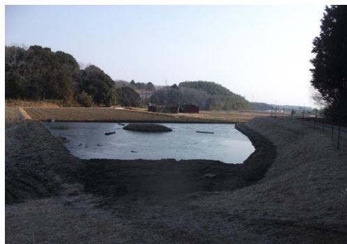
平成29年 ビオトープの保全