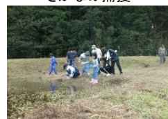
ビオトープに放流