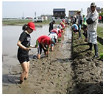
小学生による体験